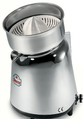
Sirman Соковыжималки , model Apollo :

Sirman Spa Viale dell'Industria 9/11 35010 PIEVE DI CURTAROLO (PD), Italy Tel./Fax. +39 049 9698666 / +39 049 9698688 email: info@sirman.com