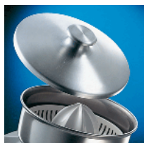
Lid - optional