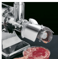
Tomato sauce making