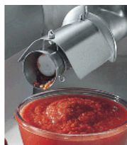
Optional tomate sauce making